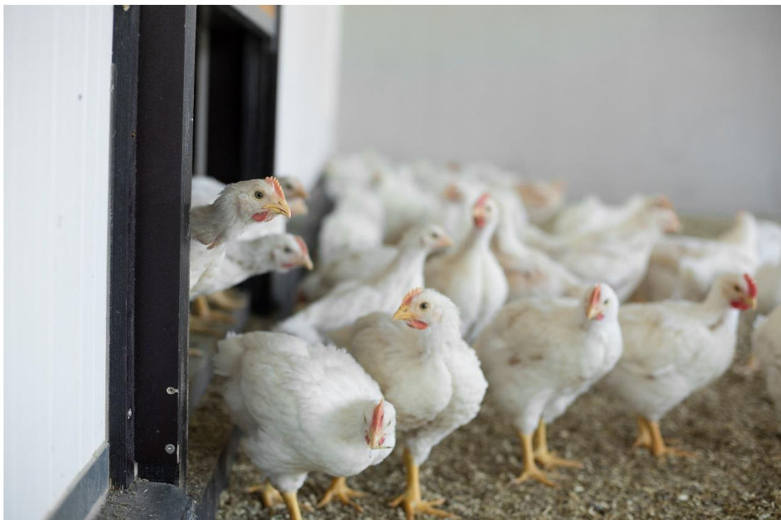
1-Ster Beter Leven vleeskuikens in de overdekte uitloop

Reguliere vleeskuikens krijgen een aaneengesloten donkerperiode van minimaal 4 uur; dit is dus waarschijnlijk te weinig voor de kuikens om ongestoord te kunnen rusten. Kuikens die een donkerperiode van 10 uur kregen ontwikkelden het meest gesynchroniseerde gedrag, gevolgd door kuikens met een donkerperiode van 7 uur 45 . De supermarktconcepten (m.u.v. de Nieuwe Standaard Kip) stellen minimaal 6 uur aaneengesloten donkerperiode verplicht, bij de Nieuwe Standaard Kip, Beter Leven keurmerk 1 ster en biologisch is dit minimaal 8 uur.