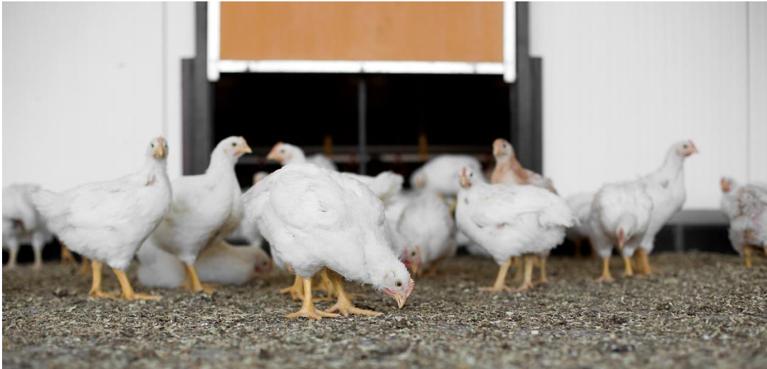
1-Ster Beter Leven vleeskuikens in de overdekte uitloop

Kuikens die een donkerperiode van 10 uur kregen ontwikkelden het meest gesynchroniseerde gedrag, gevolgd door kuikens met een donkerperiode van 7 uur 45 . Dit betekent dat de Nieuwe Standaard Kip , het Beter Leven keurmerk 1 ster en biologisch hier het best op scoren.