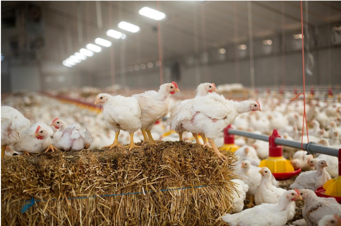
Strobalen bieden vleeskuikens onder andere de mogelijkheid om te foerageren

voor frustratie 102 . Als kuikens minder wegen op jonge leeftijd kunnen ze zich beter voortbewegen en ontwikkelen ze langere botten in hun poten 103 . Trager groeiende dieren (zowel vleeskuikens als vleeskuikenouderdieren) zullen dus beter in staat zijn om foerageer- en exploreergedrag te vertonen, wat hun welzijn positief beïnvloedt.