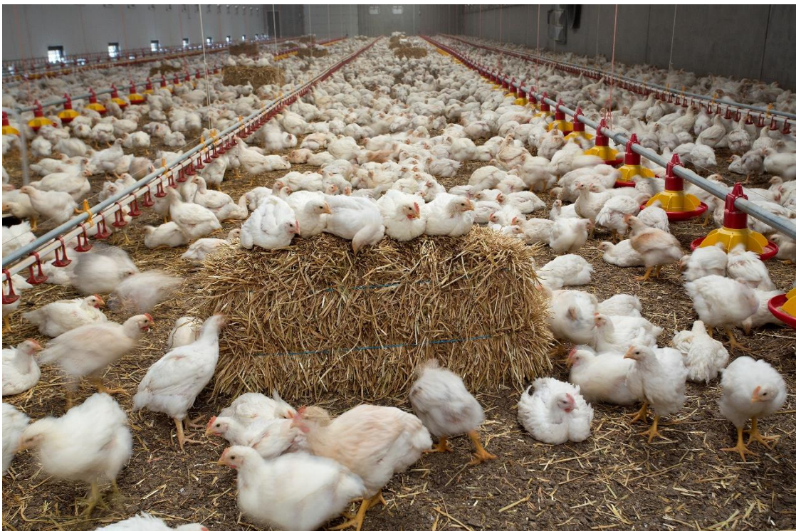
Vleeskuikens rusten graag op een verhoging

Omdat er op het gebied van rustcomfort geen aanvullende eisen per concept zijn voor vleeskuikenouderdieren (behalve voor de bezettingsdichtheid), wordt deze groep hier grotendeels buiten beschouwing gelaten. Aangenomen wordt dat verschillen bij de vleeskuikens die met de genetica te maken hebben ook gelden voor de ouderdieren. Verder zijn de verschillen tussen de concepten wat betreft de ouderdieren-waarschijnlijk klein.