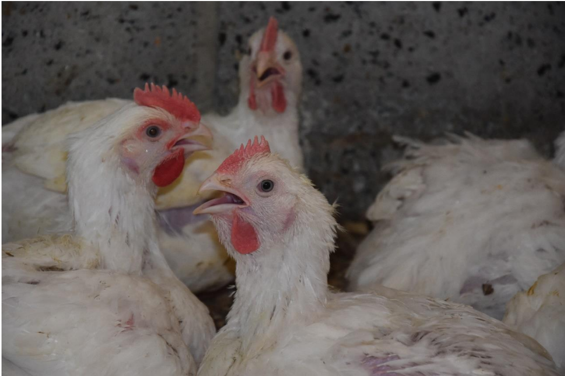
Vleeskuikens met hittestress zijn te herkennen doordat ze met de bek open ademen