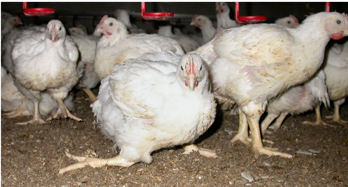
Vleeskuikens met een ernstige pootafwijking

Kreupelheid bij vleeskuikens kan verschillende oorzaken hebben. Een belangrijke risicofactor is de groeisnelheid van de dieren 54,55 . Het is dus zeer waarschijnlijk dat een lagere groeisnelheid samengaat met een kleinere kans op kreupelheid. Daarbij moet wel worden opgemerkt dat ook andere factoren een rol spelen bij het ontstaan van kreupelheid. De genetica van het dier speelt een rol: er kan, bij een zelfde groeisnelheid, geselecteerd worden op minder pootaandoeningen 19 . Daarnaast is ook het (slacht)gewicht van de dieren van belang: hoe zwaarder, hoe meer kans op kreupelheid 54,55 . Ook activiteit van de dieren kan een effect hebben op het ontstaan van kreupelheid. Vleeskuikens zijn actiever tijdens de lichtperiode als ze een langere donkerperiode krijgen, en een langere donkerperiode leidt tot minder kreupelheid en voetzoollaesies 44,55,56 . Kuikens hebben de laagste groeisnelheid, en krijgen de langste donkerperiode bij biologische productie, het Beter Leven keurmerk 1 ster , en de Nieuwe Standaard Kip , gevolgd door de overige supermarktconcepten en reguliere vleeskuikens .